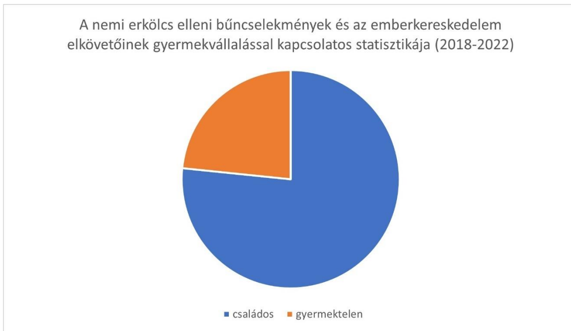
2. ábra: A nemi erkölcs elleni bűncselekmények és az emberkereskedelem elkövetőinek gyermekvállalással kapcsolatos statisztikája a 2018-tól 2022-ig vizsgált anonimizált bírósági határozatok alapján

A fenti diagramból kitűnik, hogy az elkövetők nagy részének (76,6%) legalább egy gyereke született, amikor a bírósági eljárás folyt, közülük is a többség már a bűncselekmény elkövetésekor szülőnek számított. Ez az adat megcáfolja azt a tévhitet, amely szerint az elkövetők sok esetben magányos, egyedülálló férfiak. 4 A második jelzőt itt annyiban tartom relevánsnak, hogy összességében nézve a többségük csupán élettársi kapcsolatban állt, amely a hatóság tudomására jutása előtt vagy az eljárás alatt megszűnt. Jellemző ezekre a párkapcsolatokra, hogy problémákkal teli, sok esetben jár valamelyik fél bántalmazásával akár szóban, akár fizikailag.